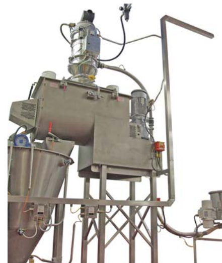
e) Системы подачи и транспортировки ингредиентов